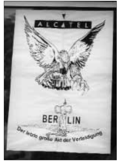
Solidaritätskundgebung am 21. September auf dem Werksgelände

Nordamerika und jeweils knapp 10 Prozent in Asien und dem Rest der Welt abgesetzt.