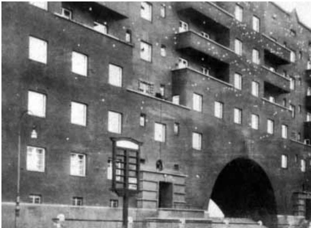
DER VON HEIMWEHR UND MILITÄR AM 12. FEBRUAR 1934 ZERSCHOSSENE KARL-MARX-HOF, EIN REFORM-WOHNUNGS- PROJEKT DER SPÖ.

sungswidrig absetzte und die Verwaltung Wiens einem Regierungskommissar übertrug;